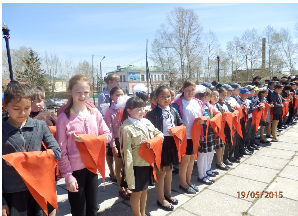
Пятиклассники вступают в ряды пионеров .