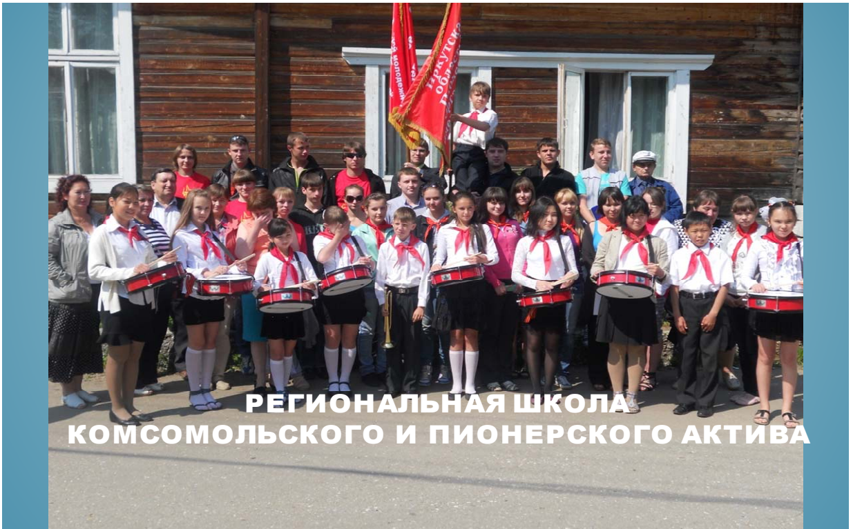
РЕГИОНАЛЬНАЯ ШКОЛА КОМСОМОЛЬСКОГО И ПИОНЕРСКОГО АКТИВА