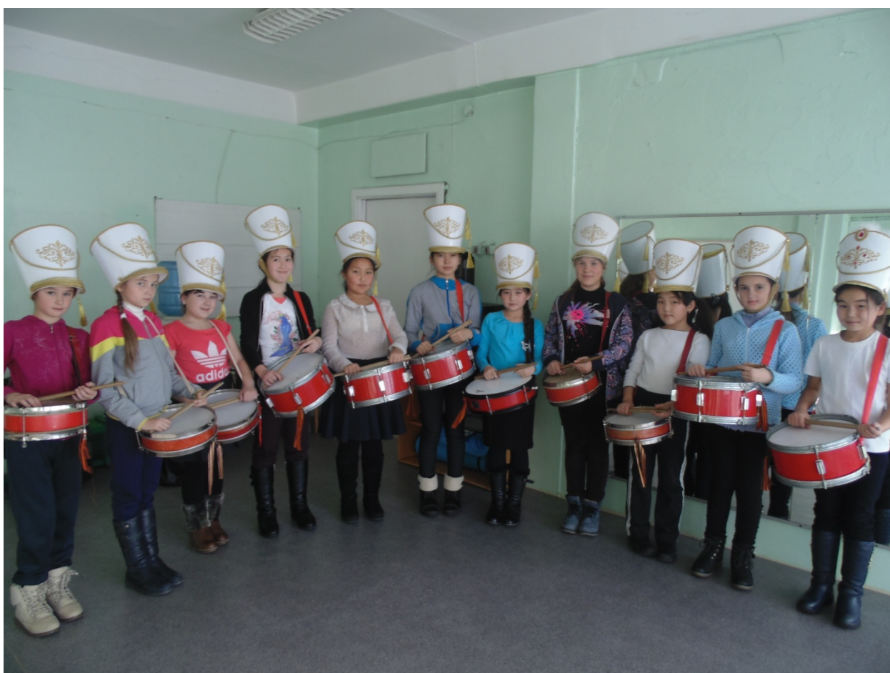
Младшая группа барабанщиков.

Выступление на празднике, посвящённом Дню пионерии.