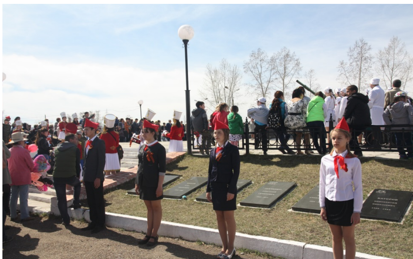
Ежегодно 9 мая на митинге пионеры встают в почетный караул