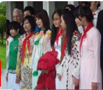
С пионерами Вьетнама