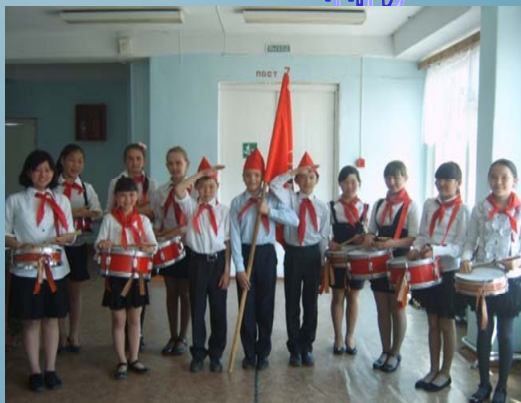
■ наш пионерский актив

В зоне пионерского внимания находились ветераны ВОВ и труда, пионеры дружины «Факел» принимали непосредственное участие в парадах и митингах, посвященных Дню Победы: