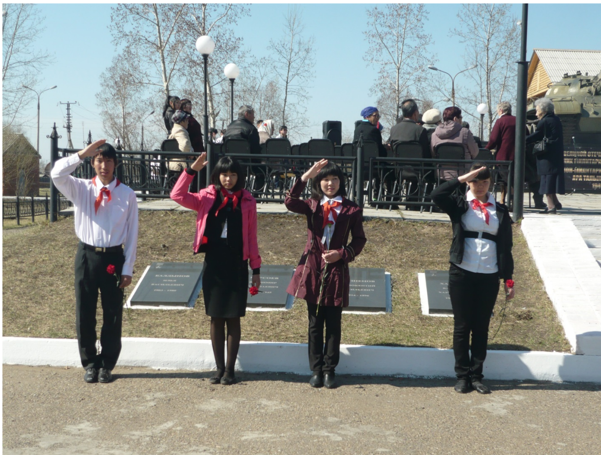
Почетный караул 9 мая