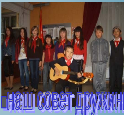
■ наш совет дружины