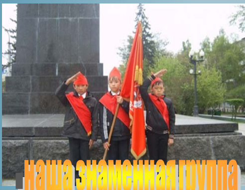
■ наша знаменная группа