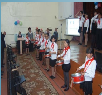
■ наша барабанная группа